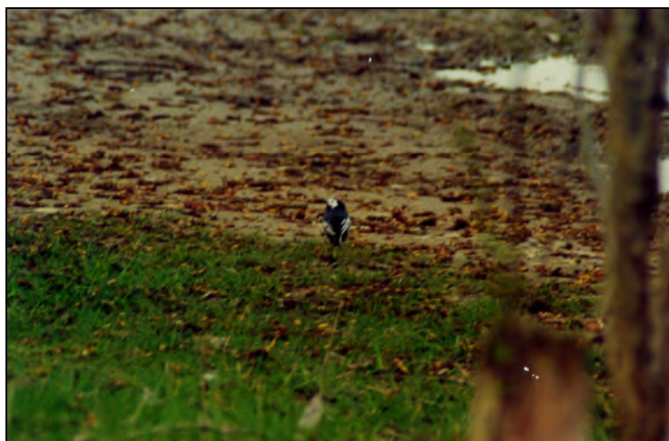
Bachstelze mit Merkmalen der Unterart yarrellii an der Kiesgrube Reinshof, April 2001.

An der Kiesgrube Reinshof wurden bei den morgendlichen Planbeobachtungen vom 03.09.-30.10. insgesamt 415 rastende Ind. (eingeschlossen mehrtägig präsente Vögel) gezählt, die maximale Tagessumme betrug 85 Ind. am 09.10. (HD, CG). Ein Schlafplatz war dort vom 15.-22.10. von 40-70 Ind. besetzt (CG).