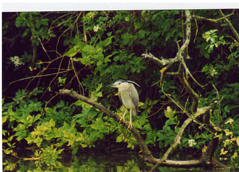
Nachtreiher am Göttinger Kiessee im Juni 2001.

Möglicherweise betreffen die Beobachtungen einen in der Region umherstreifenden Vogel.